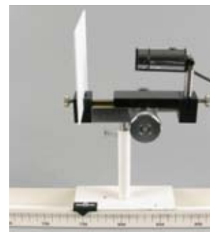
Utilisation avec la caméra Ovisio.