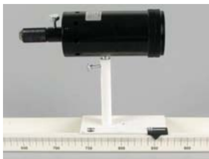
Utilisation avec une lanterne.